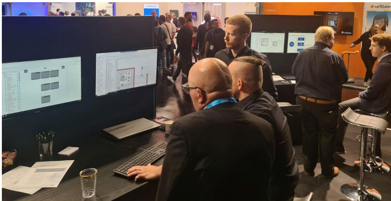
Stark frequentiert waren beide SECIRA®-Demostationen

An zwei Demostationen, die stets dicht umlagert waren, machte die ICS anhand komplexer Beispielinfrastrukturen klar, bis in welche Cybersecurity-Dimensionen man mit SECIRA® vordringen kann. Besonders eindrücklich demonstrierte die ICS die Qualitäten der Plattform an einem simplen Szenario – dem Kauf von Software unter Cybersecurity-Kriterien: „SECIRA® visualisiert anhand des Digitalen Zwillings und dem sich daraus ergebenden Angriffsbaum für jeden greifbar und auf Knopfdruck, welche Sicherheitslücken für die Kundeninfrastruktur die größten Risiken bergen und wie man diese mit gezielten Maßnahmen schließen kann“ , erläutert Patric Birr. „Dieses einfache Beispiel hat unsere Besucherinnen und Besucher geradezu euphorisiert.“