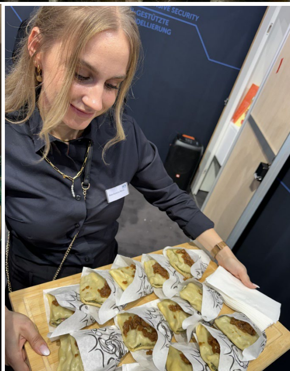
Der ICS-Messeausklang am Mittwochabend fand ebenfalls großen Anklang