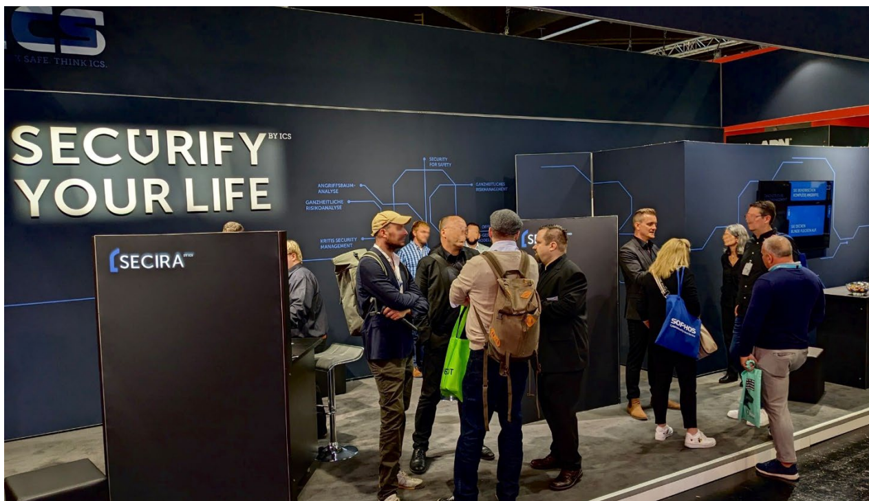
Der ICS-Stand in Halle 6 auf der it-sa war gut besucht

Stuttgart, 24.10.2023: Cybersecurity erwies sich vom 10. bis 12. Oktober auf der internationalen Branchenmesse it-sa 2023 in Nürnberg, wie erwartet, als das beherrschende Thema. Entsprechend elektrisiert zeigte sich das Publikum auf dem Stand der ICS GmbH von der Innovation SECIRA®: Die Plattform ermöglicht ganzheitliches automatisiertes Risikomanagement auf Knopfdruck.