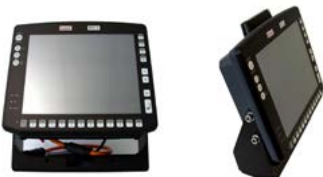
DLOG MPC5, eine der Zielplattformen

Um die gesteckten Ziele erfolgreich umzusetzen, wurde ein workflowbasierter Ansatz unter Verwendung einer selbst erstellten Workflowengine gewählt, mittels deren eine Konfigurierbarkeit bis hinunter auf Anwenderebene ermöglicht wird. Durch die konsequente Auslagerung aller Konfigurationsdaten in die Datenbank ist es möglich einzelne Workflows zur Laufzeit des Systems zu erstellen. Dadurch verringert sich die Reaktionszeit auf Wunsch des Fachbereichs drastisch. Zusätzlich werden die sonst für Erweiterungen notwendigen Downzeiten des ganzen Systems auf ein Minimum beschränkt, wodurch weitere Kosten eingespart werden.