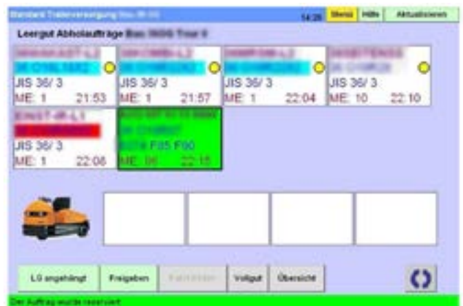
Beispielworkflow für die Tourabwicklung

Die ergonomische Bedienung durch einfaches Auswählen mittels Touchscreen und die durch die beleglose Abwicklung reduzierten Auf-/und Absitzvorgänge von den Staplern und Transportwagen, sorgen für ein angenehmes und effizienteres Arbeiten.